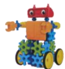
6 th prize Remote Control Gear-bot

Raffle is going to take place at the Parish Kermes | La rifa se llevará a cabo durante la Kermes Parroquial