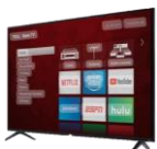
1 st prize Smart TV TCL-Roku 55"

Tickets available after mass 1/$5 or 5/$20. | Boletos disponibles después de misa a 1/$5 o 5/$20.