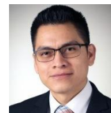
Nicolas Leon Felipe English Immersion Program Programa de Inmersión Inglés Our Lady of the Desert Parish, Mattawa WA